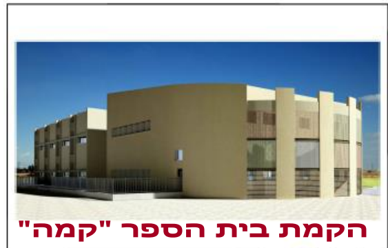
הקמת בית הספר "קמה"